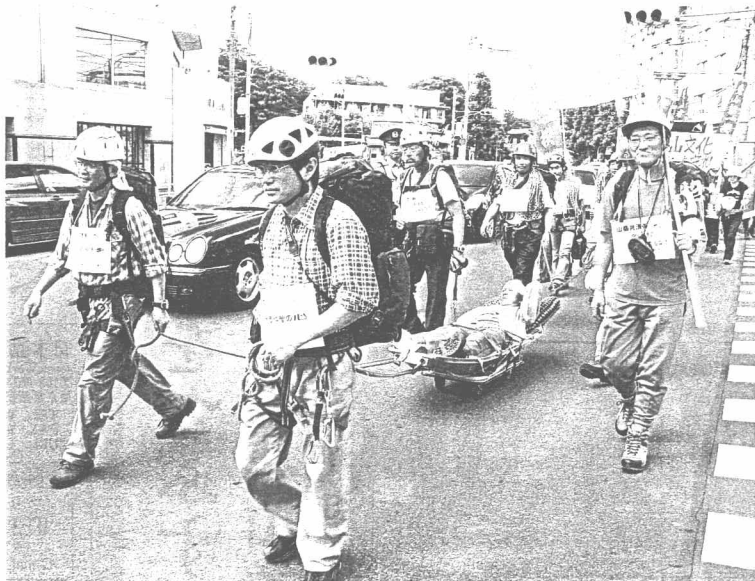
模擬事故者を乗せたアキヤ(携帯担架)を引く登山者救助隊員

集会当日は前日の雨が降った。旗やスコップを掲げた手集いで、冒険探検を終えてのようになり、午後2時過ぎから登山者集は開会した。ヘルメットやザイルで集合した登山者集は開会した。ヘルメットやザイルで集合した登山者集は開会した。ヘルメットやザイルで集合した登山者集は開会した。