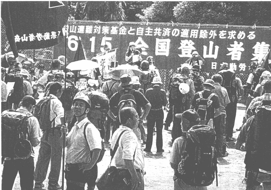
登山者集と自主共済適用除外を求める6・15全国登山者集会(07年6月15日 東京都港区都立青山公園)