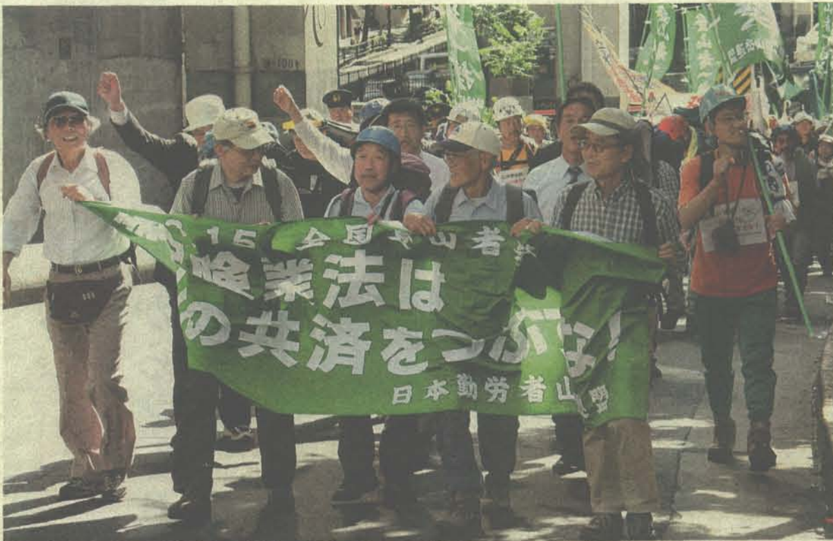
六本木通りを行進する250名の登山者アモ (07年6月15日 東京都港区)

フリーダイヤル 0120-44-2742 (平日10時~18時) E-mail: jwaf@jwaf.jp