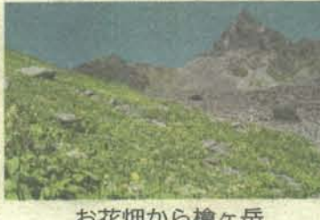
お花畑から槍ヶ岳

槍沢ロッジは、槍ヶ岳の中腹にある山小屋です。夏には、8月24日「フルートコンサート」、8月31日「播