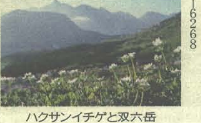
ハクサンイチゲと双六岳