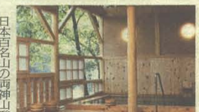
かけ流し露天風呂

日本百名山の両神山登山の方々が多く利用していただいている秩父の静かな温泉宿です。天然温泉かけ流し露天風呂が大変好評。期間限定特別プラン(9