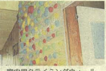
室内用クライミングウォール

八ヶ岳硫黄岳直下に湧く本沢温泉もお隣様で創業百二十五年を迎えられた事になりました。そこで、9月6日泊まりまで、感謝の企画として「のんびり湯つたりプラン」を行います。ひなびた温泉宿でのんびりと山旅と温泉を楽しんでください。