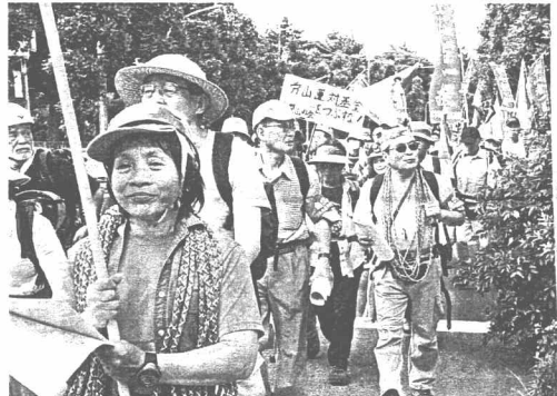
青山公園からにぎやかにアモ行進が出発

国会で要請書を渡す。翌朝NHKTVが全国放送。登山者集は開会した。ヘルメットやザイルで集合した登山者集は開会した。ヘルメットやザイルで集合した登山者集は開会した。